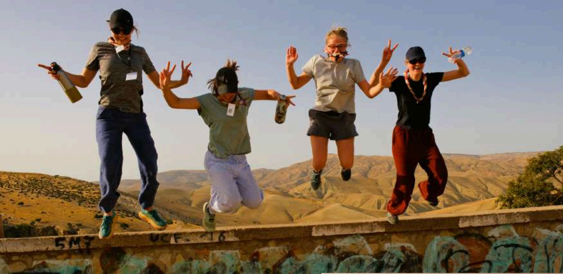
INVERSIONS LE COURS DES CHOSSES